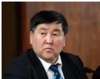
УИХ-ын гишүүн Ц. Батбаяр