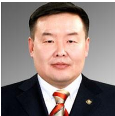
Гадаад Хэргийн сайд Г. Занданшатар