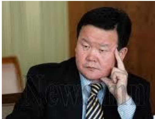
УИХ-ын гишүүн О. Чулуунбат